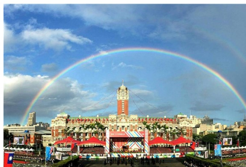
雙十國慶。慶祝活動